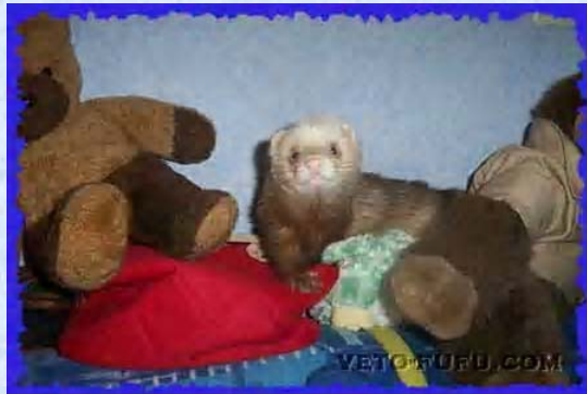
Muscat Furet cannelle