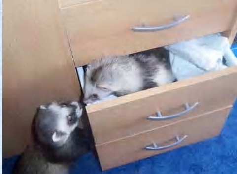
Ca rentre partout...