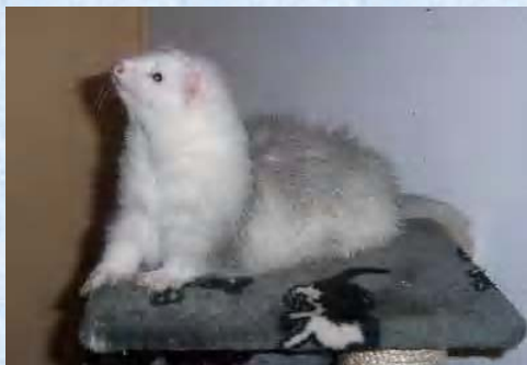
Quai-Gonn Furet angora silver arlequin