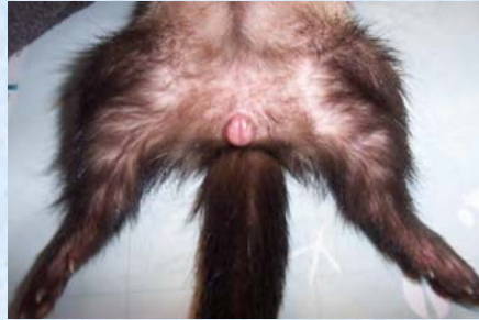
Vulve à 1 semaine de chaleurs