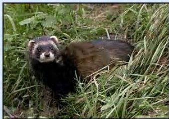
Putois Européen www.wildaboutbritain.co.uk