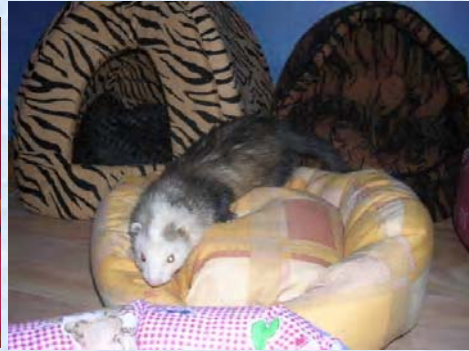
Furet badger (= blaze, flamme...)