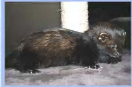
Opaca Furet blackself