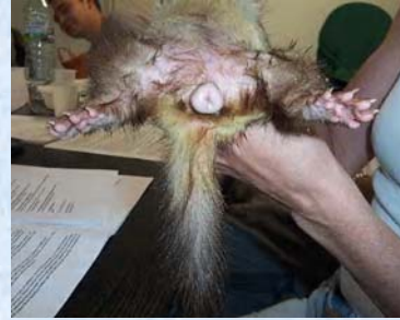
Vulve après saillie