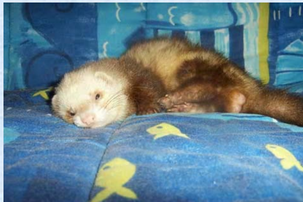
Testicules de mâle en rut