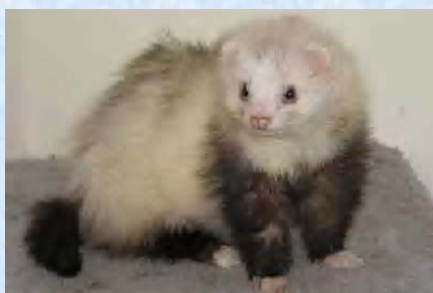
Anakine Furet angora arlequin