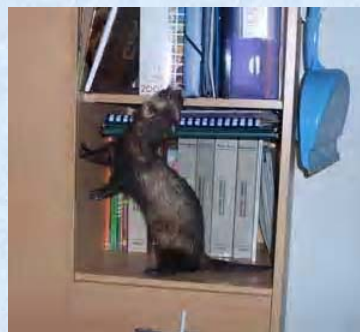
Ca grimpe partout... (Pas de notion de hauteur !!)