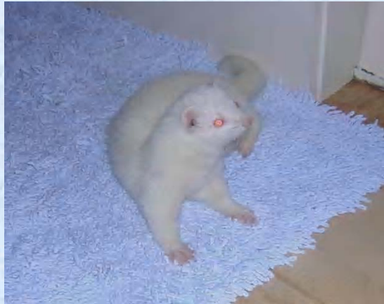
Germaine Furette albinos