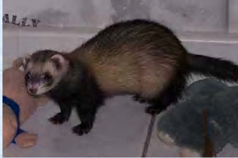
Leelo Furette putoisée sable