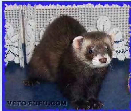
Dakar Furet blackself