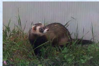
Dakar (Furet ou hybride ?)