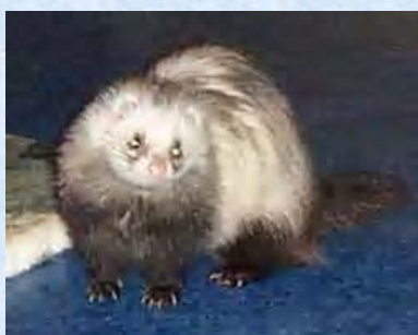
Princesse Furette angora sable