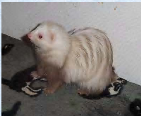
Kenya Furette angora champagne