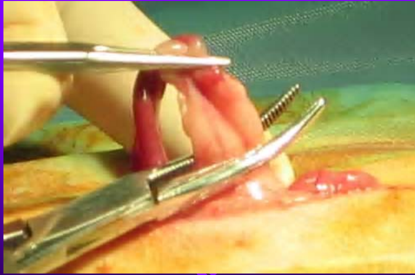
Pose du deuxième clamp