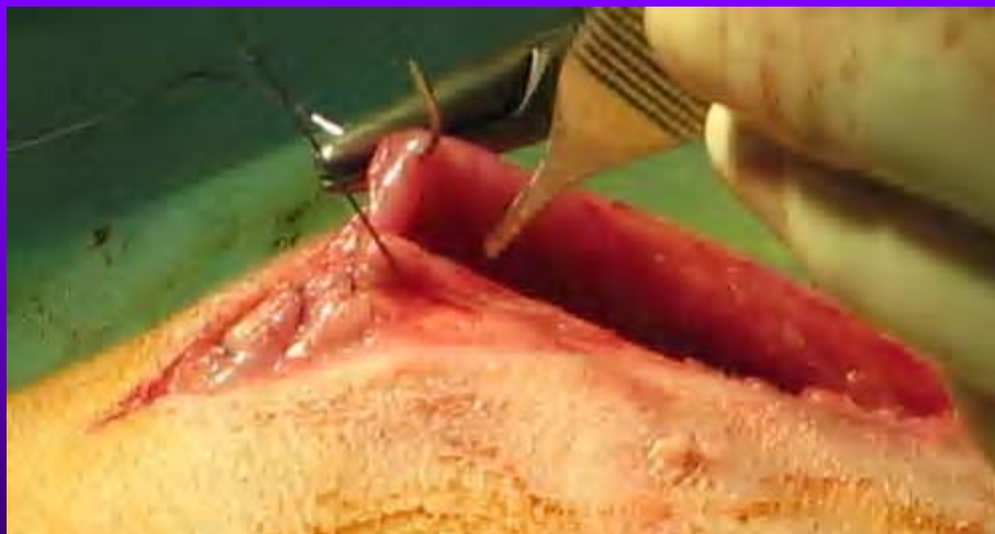
Suture de la paroi musculaire