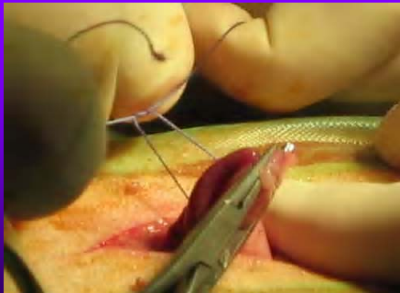
Pose des ligatures