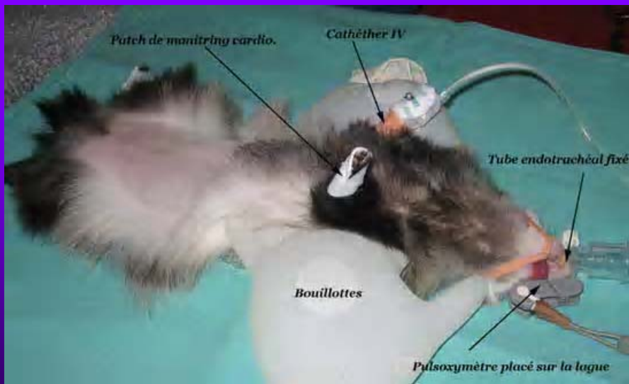
Mise en place des différents monitoring