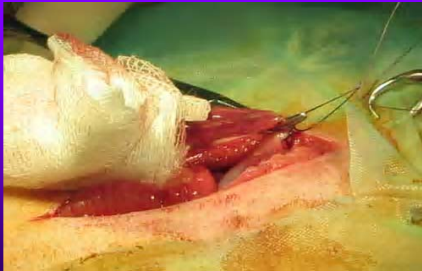
Ligature(s) de l'utérus