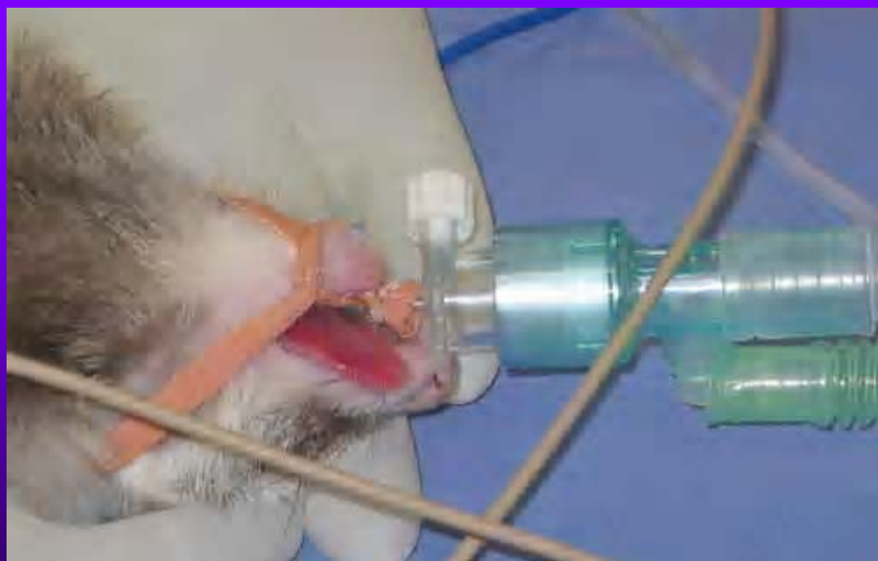
Tube endotrachéal relié au circuit