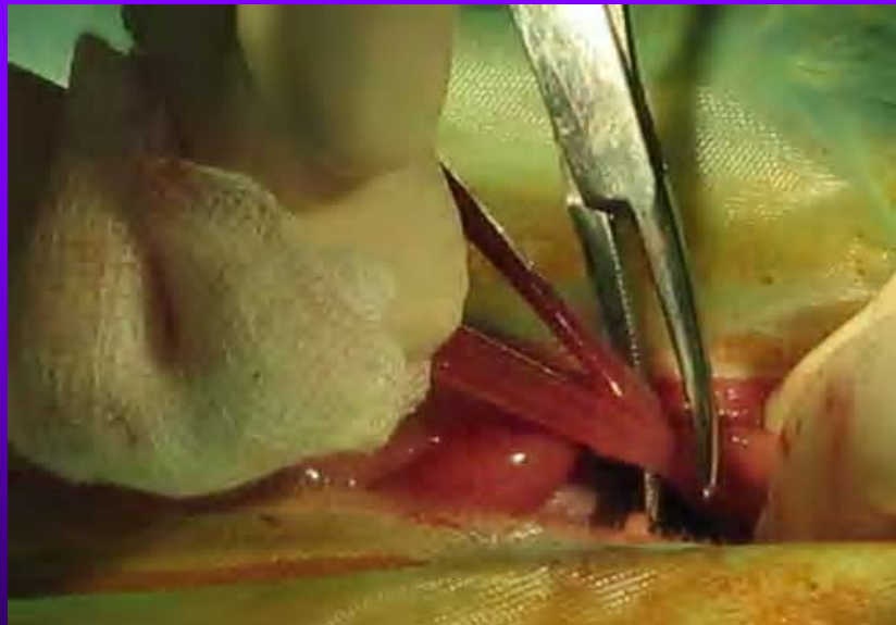
Clampage de l'utérus