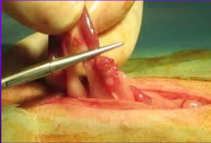
Pose du premier clamp