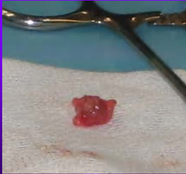
Ovaire dans sa bourse