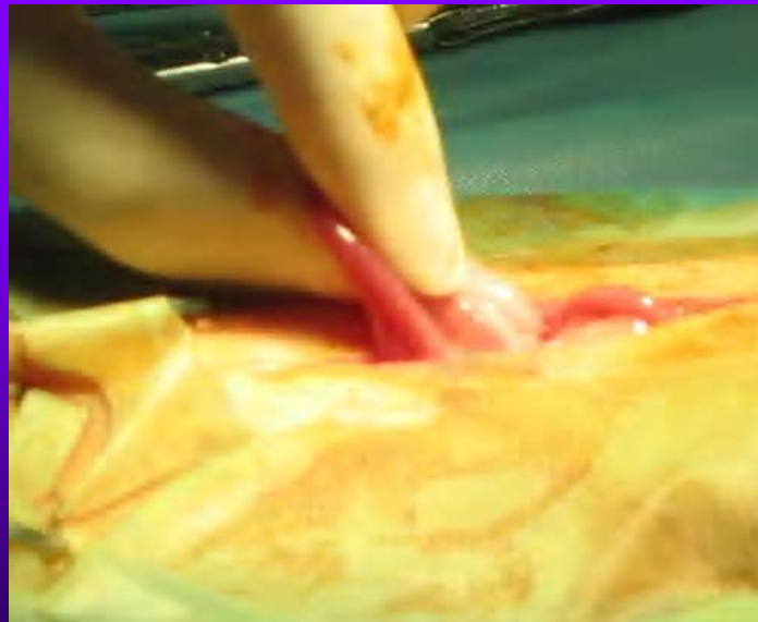
Extériorisation de la corne (avec le doigt ou au crochet)