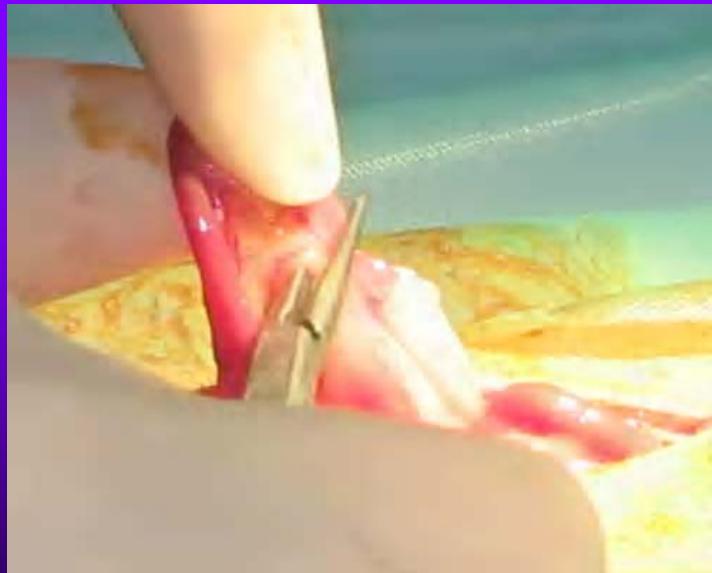
Pose du premier clamp