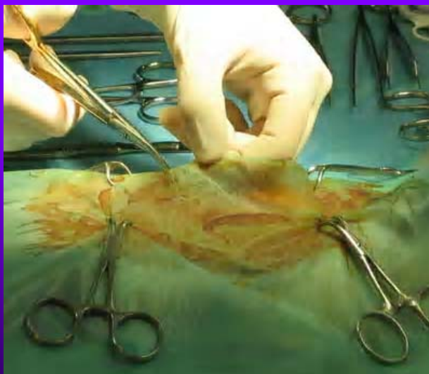
Coupe de l'ouverture de champ