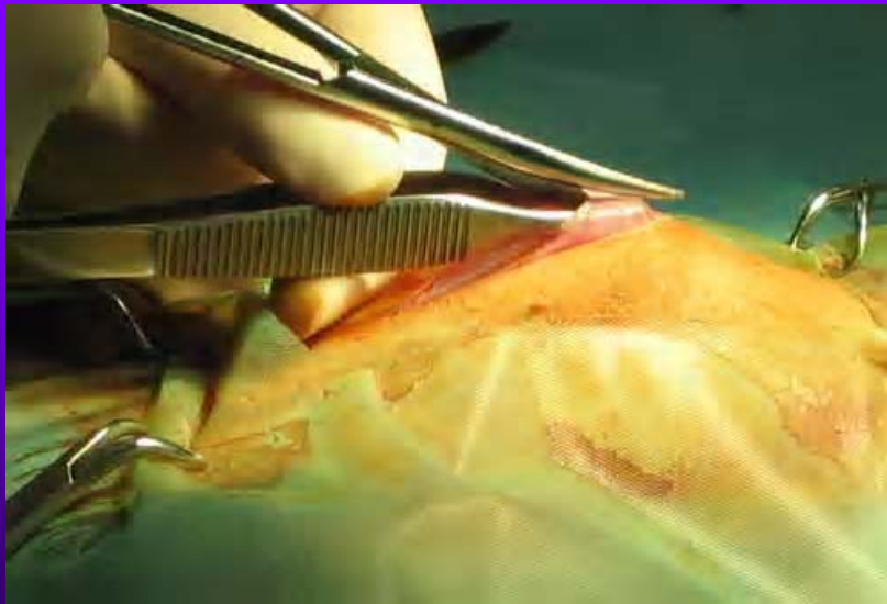
Ouverture de la paroi musculaire