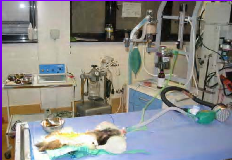
Bloc opératoire OPA