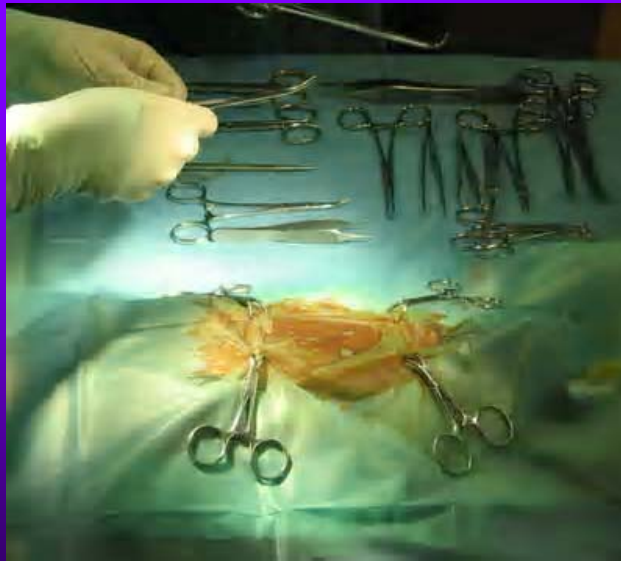
Pose du champ à usage unique